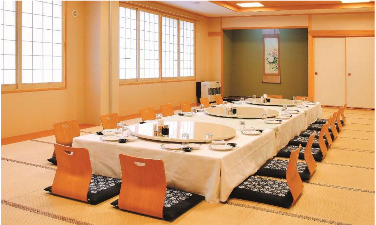
① ふじの間 20名様まで ②かえでの間 20名様まで ①②[全室]50名様まで